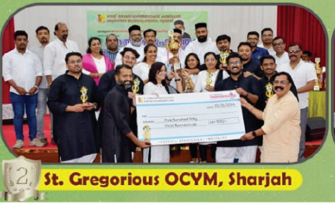
St. Gregorius OCYM, Sharjah