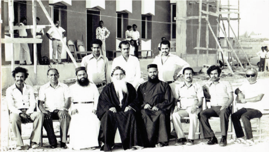
This photo is taken during our first church construction.

എന്നും ഓർമ്മകളിൽ നമ്മുടെ ഇടവകയുടെ ഫോട്ടോ ഗാലറിയിൽ നിന്നും ലഭിച്ചത്.