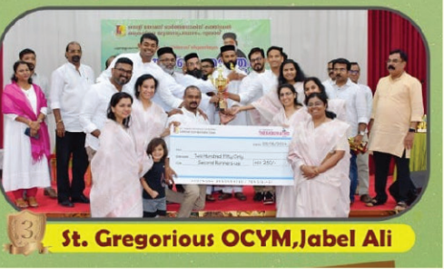
St. Gregorius OCYM, Jabel Ali