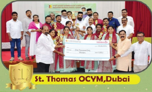
St. Thomas OCYM, Dubai